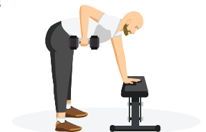
flexion avec appui sur haltères