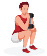
accroupissement avec haltère